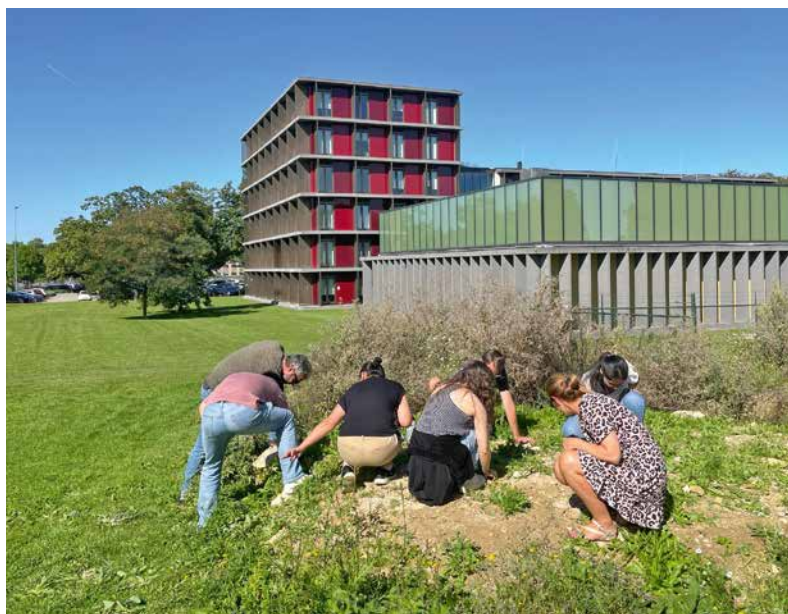
Bijenhotspot Randwijck. Vóór het zaaien eerst wieden.