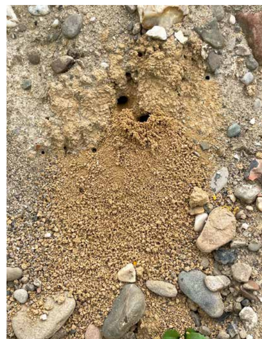
Meerdere bijensoorten nestelen naast elkaar op een klein oppervlak.