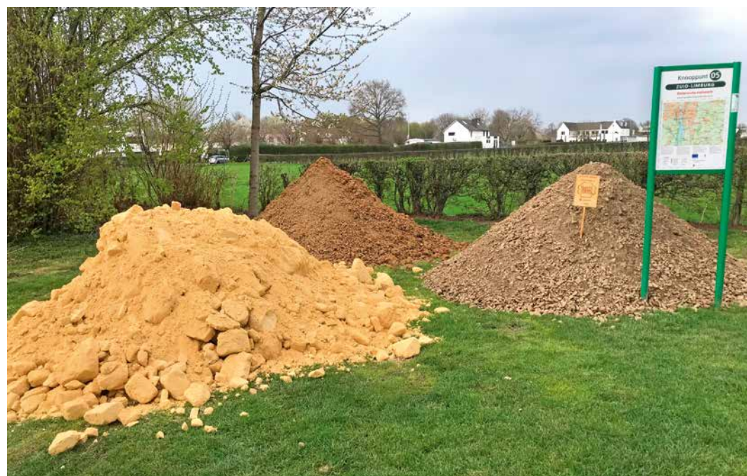
Mergel, leem en stol liggen klaar bij fietsknooppunt Torenmolen voor de aanleg van nestheuvels voor wilde bijen.

Dat bracht CNME op het idee om slangenkruid samen met de slangenkruidbij te bombarderen tot Maastrichtse icoonsoorten. Slangenkruid is een aantrekkelijke forse plant die later in het seizoen prachtig blauw bloeit en een levensvoordeel is voor de uiterst kieskeurige slangenkruidbij. Het vrouwtje gebruikt alleen stuifmeel