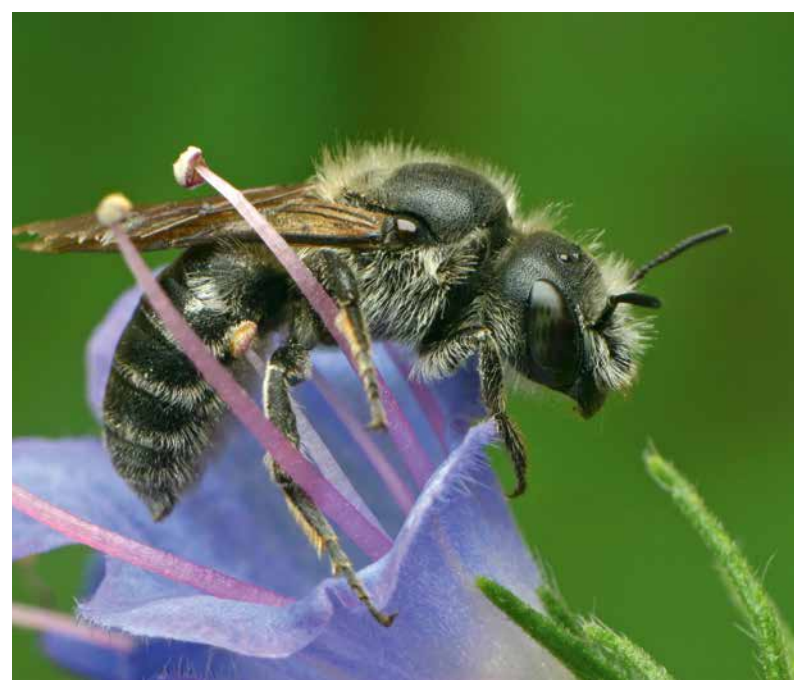
Slangenkruidbij vrouw op slangenkruid.