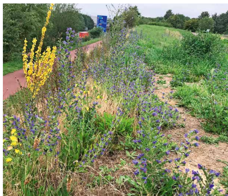
Grondwal De Heeg langs de A2: de eerste geslaagde bijenbuitop.